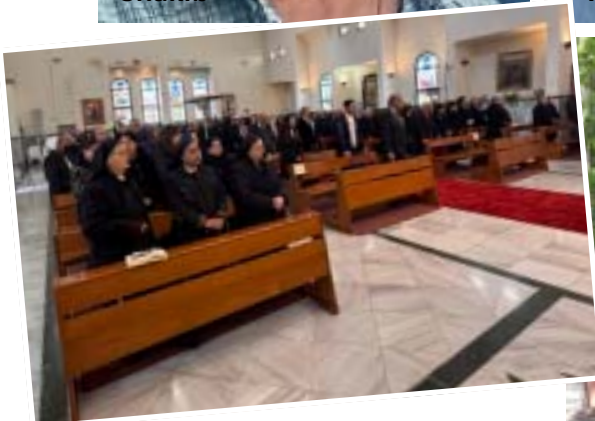
9 febbraio 2025 Festa di Mar Marun a Nazaret